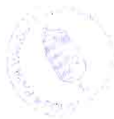
Dr. Áldozó Tamás polgármester

Az alapító okiratot Pápa Város Önkormányzatának Képviselőtestülete a 13/2011. (II.25.) határozatának I./6. pontjával hagyta jóvá.